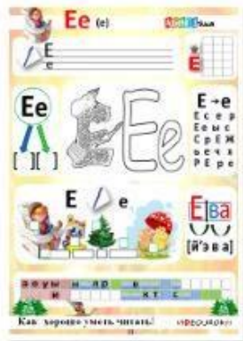
13. Гласные буквы Е, е