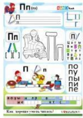
14. Согласные звуки [п], [п'] буквы П, п