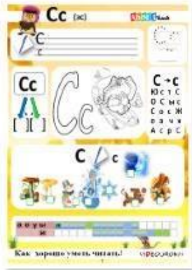
7. Согласные звуки [с], [с'] буквы С, с