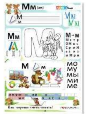
15. Согласные звуки [м], [м'] буквы М, м