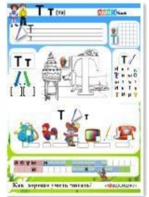
9. Согласные звуки [т], [т'] буквы Т, т