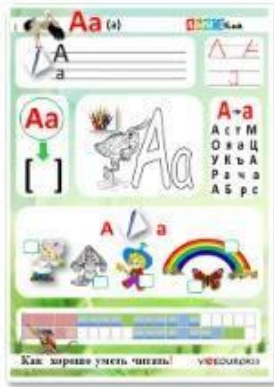
1. Гласный звук [а], буквы А, а