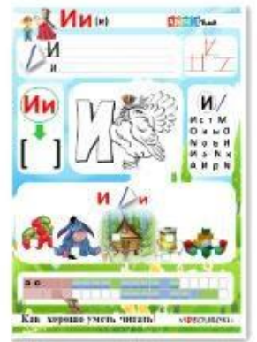
3. Гласный звук [и], буквы И, и