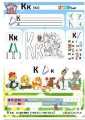
8. Согласные звуки [к], [к'] буквы К, к