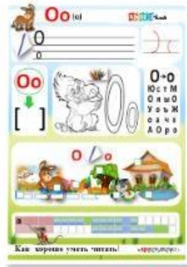
2. Гласный звук [о], буквы О, о