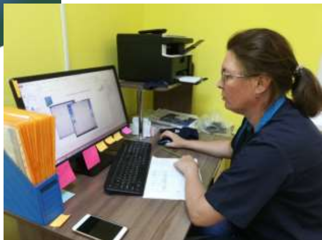
Чек лист подготовки пакета документов для ТерПМПК