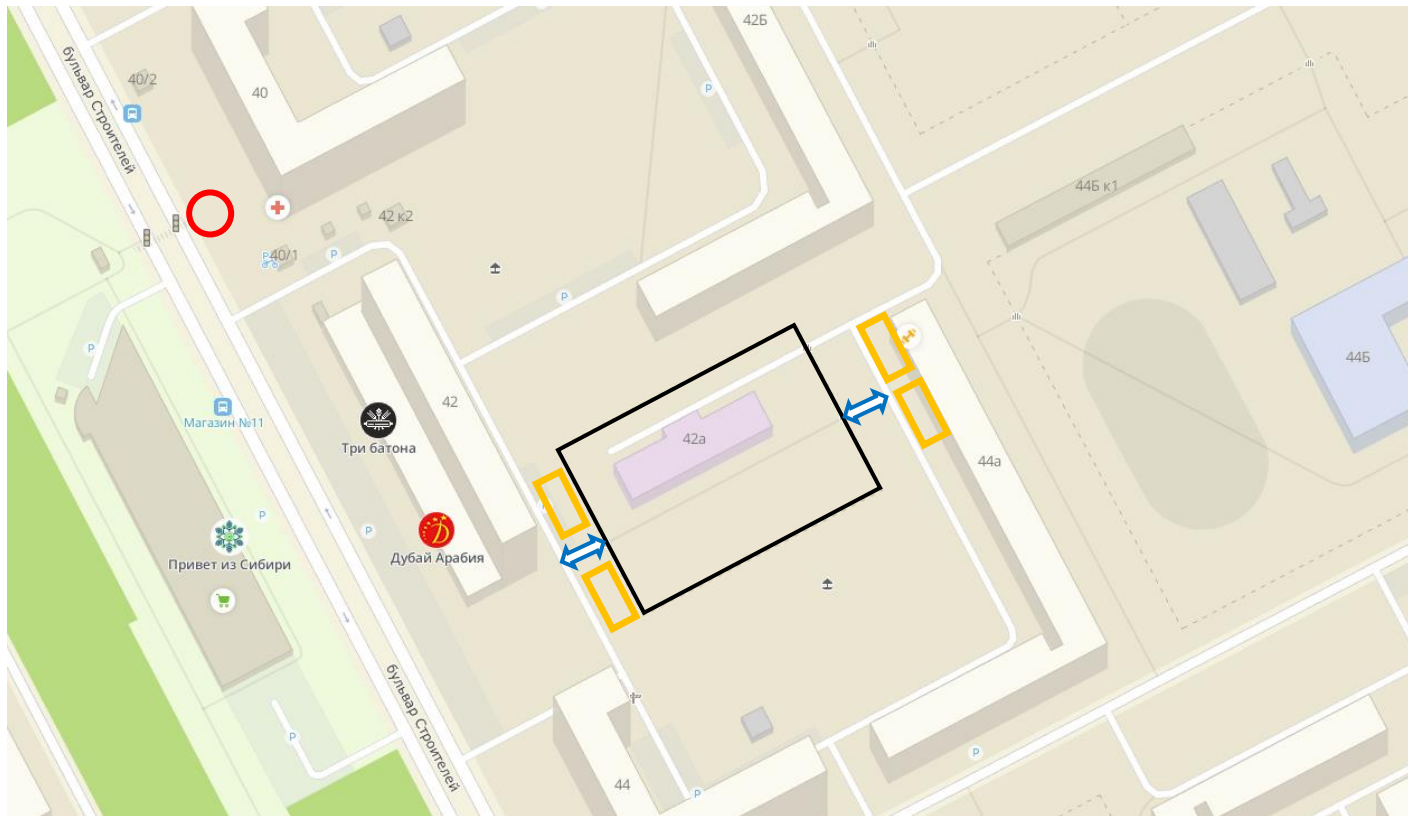
СХЕМА Организация дорожного движения в непосредственной близости от образовательной организации